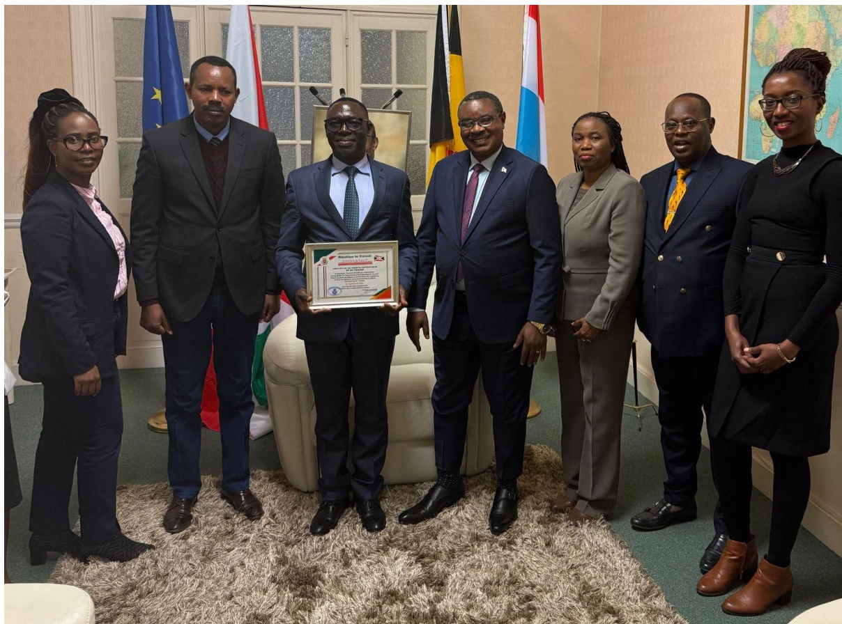
Photo de Famille après la remise du Certificat de reconnaissance