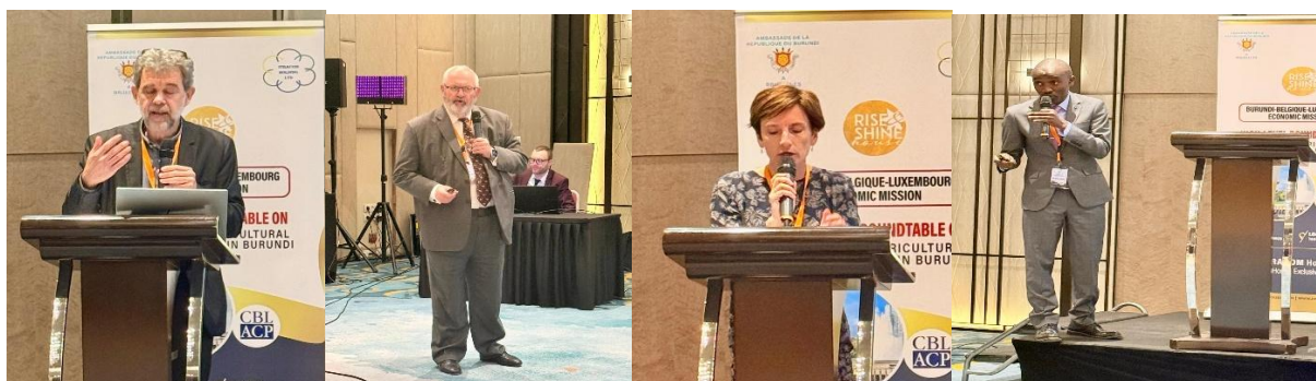
Quelques photos de certains experts du Panel I

Le panel centré sur la « Transformation agricole et renforcement des chaînes de valeur au Burundi : innovations agronomiques et zootechniques pour un développement durable » était animé par des experts, notamment des professeurs de l'Université de Gembloux, ainsi que des représentants de l'ENABEL, du CBL-ACP et de la Direction générale des partenariats internationaux (INTPA) de l'UE.