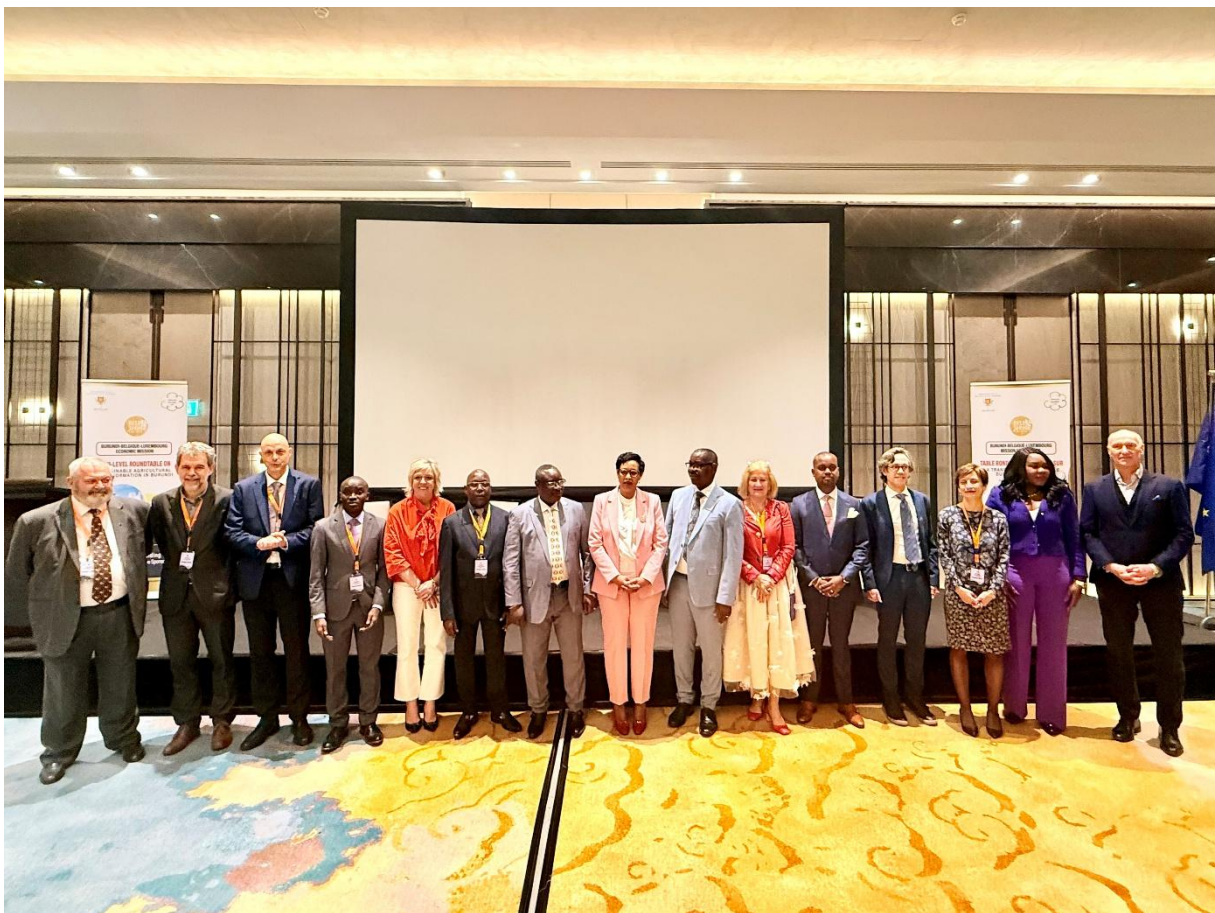
Photo de famille des orateurs et panelistes de la Table ronde de haut niveau

En conclusion, cette table ronde a constitué une plateforme stratégique de dialogue et d'échange, permettant d'identifier des pistes concrètes pour renforcer la chaîne de valeur agricole au Burundi, tout en favorisant des partenariats durables entre les secteurs public et privé sans oublier le rôle clé de la coopération internationale.