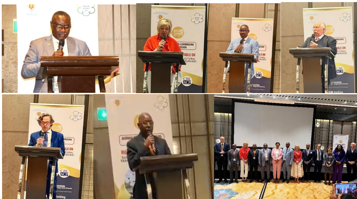
Photos illustratives des orateurs ci-haut cités